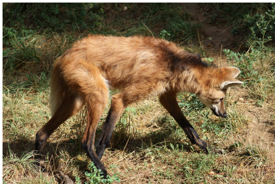
Lobo a melena

La Reserva Zoológica de Calviac, situada a 10 km de Sarlat en Dordoña, es una institución sin ánimo de lucro consagrada a la conservación de las especies amenazadas, muy particularmente las de pequeña y media talla.